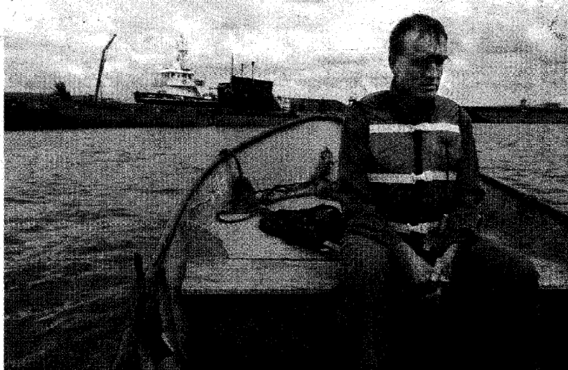
Boven: de voeten van iedere bezoeker worden ontsmet. Beneden: aan boord van de sloep.